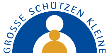
Illustration: B. Rast, Grafik Sicherheitsbären: S. Karch

Herausgeber/Inhalt: Verein GROSSE SCHÜTZEN KLEINE Auenbruggerplatz 49, 8036 Graz