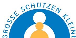
Illustration: B. Rast, Grafik Sicherheitsbär: S. Karch

Erstellt vom Verein GROSSE SCHÜTZEN KLEINE Auenbruggerplatz 49, 8036 Graz