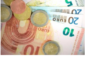
Kleingeld für den Notfall