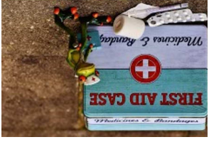
Erste Hilfe Set